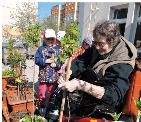
Taking shared care of the urban garden

An evaluation tool is also the Garden Diary, where there are recorded all the happenings in the garden and it serves as an overview of who works in the garden, or who comes to relax, or who comes as a visitor. We use the Diary for children to become aware of all the activities related to the garden and for the promotional purposes of the project.