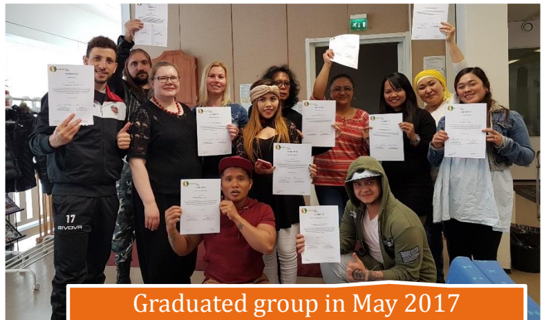
Graduated group in May 2017

The students receive certificates upon the completion of the course, which mentions their present Finnish levels skills and their development during the course. Kompassi also recommends the students to higher level courses available in Kuopio.