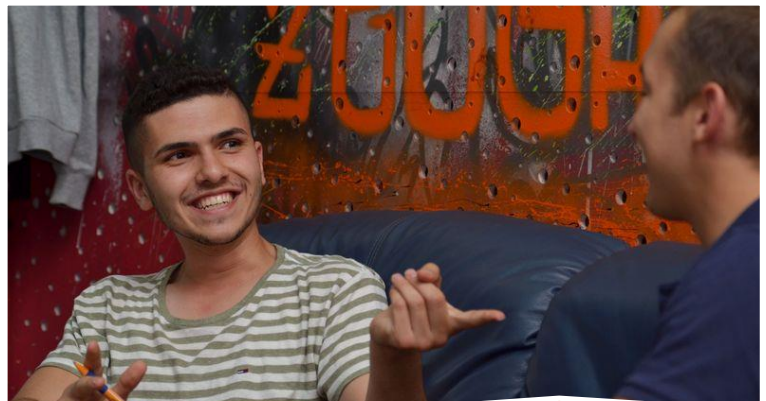
Participants of the project "TALK with ME"

Check it out yourself: www.voluntary-mentors.eu