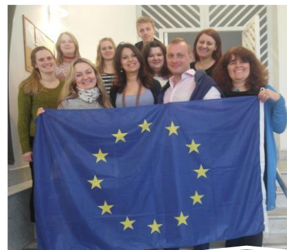
ProVol partner organisations in January 2015

To advertise the training, we used local newspapers, facebook and our email-newsletter. Additionally, we continue to present the training at (international) conferences. In 2014, we developed a European version of the training, together with partners from the UK, the Czech Republic and Slovenia. Also, we developed two manuals summarising the contents of the training, one for volunteers and one for volunteer coordinators. They are available in English, German, Czech and Slovenian on http://professional-volunteering.eu/ .