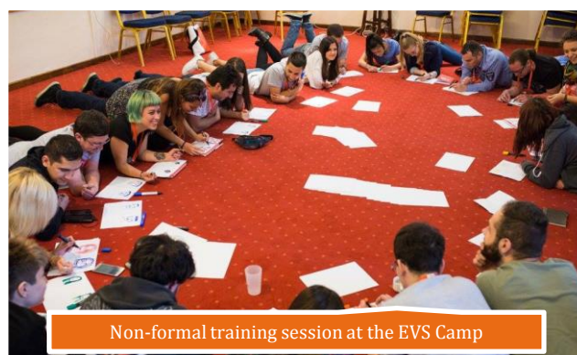
Non-formal training session at the EVS Camp

The target groups (EVS volunteers, mentors, coordinators, EVS accredited organizations, NGOs, trainers, teachers and young people interested in EVS) developed expertise, increased competences and knowledge regarding better tools and methods for EVS management and for improving volunteers' service.