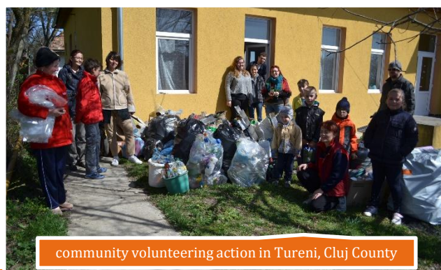
community volunteering action in Tureni, Cluj County

All along the project, local and international volunteers had a major role in facilitation of the clubs, as well as in the preparation and implementation of various activities targeting the children and the local community.