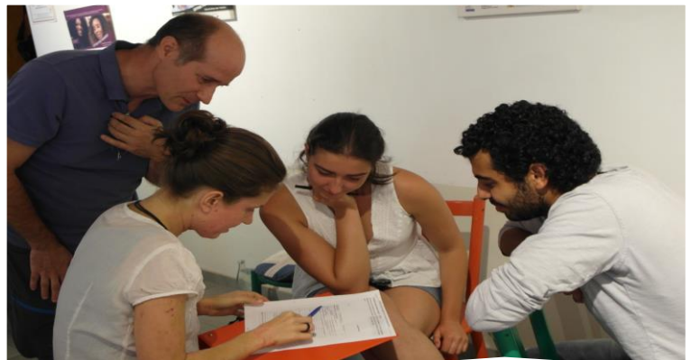
Participants of the training: Competence in the professional life 2018

To advertise the training, we used local newspapers, Facebook and our email-newsletter